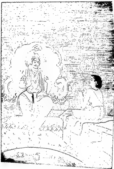
वसिष्ठ और भृगु